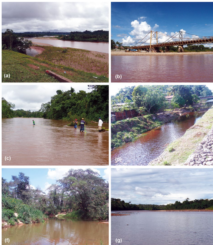
Figura 2. Ejemplos de las localidades de muestreo en la cuenca del Río Aguaytía. A. Río Aguaytía. B. Puente Aguaytía. C. Río Santa Ana. D. Río Negro. E. Río Neshuya. F. Río Shambo.