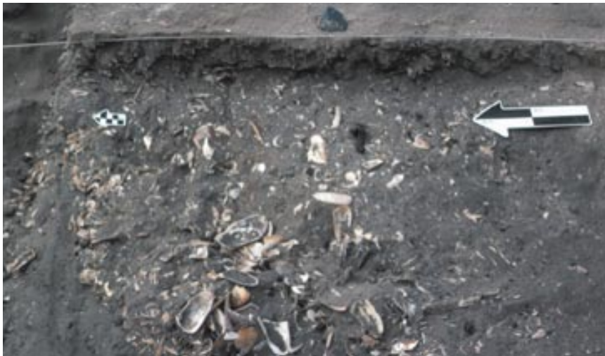
7. Detalle de machas ( Mesodesma donacium ) del Sector I en Quebrada Jaguay 280.

de los frutos (“mate”), que fueron y siguen siendo empleados como recipientes de uso diverso. El cultivo de esta planta arranca desde hace mucho tiempo. En la flora peruana hay dos especies del pteridófito mencionado, Equisetum , E. bogotense y E. giganteum , que medran en la humedad de las riberas de ríos y canales de riego. Por sus propiedades diuréticas y antiinflamatorias se utilizan en medicina. Y sus cenizas pulieron antaño objetos de plata.