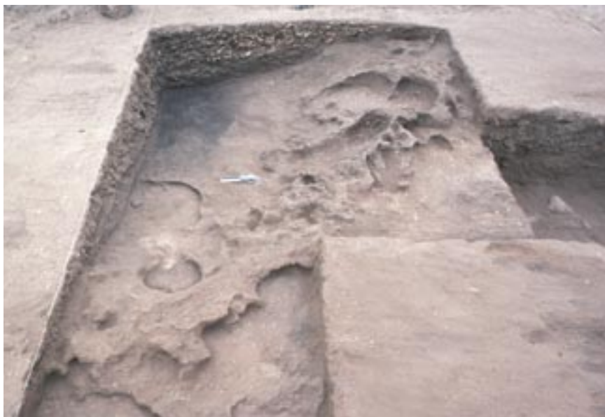
3. Parte de la casa semisubterránea con más de 8000 años de antigüedad en el Sector I del sitio QJ-280. Nótese la mancha negra del antiguo fogón.

Se procedió al análisis del radiocarbono para determinar la fecha de los desperdicios recuperados. Hasta