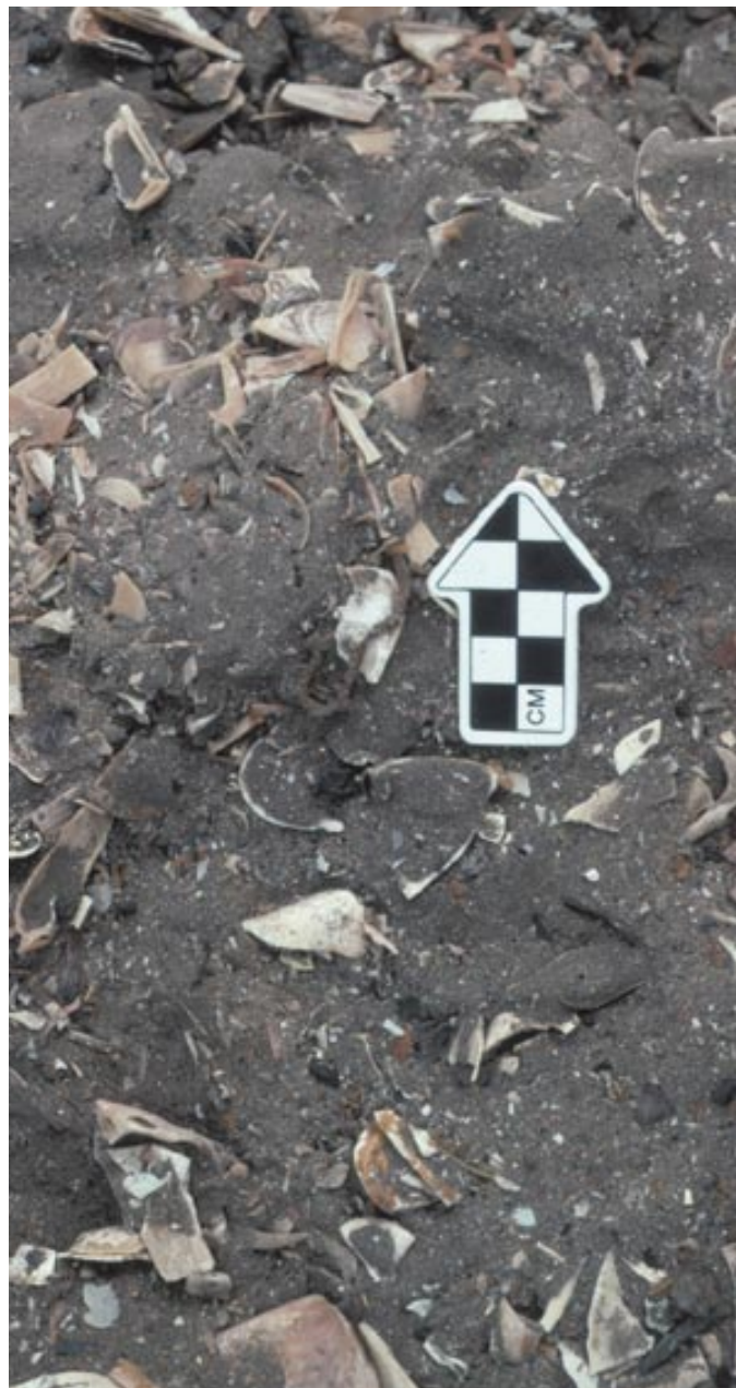
6. Restos de conchas en el sitio QJ-280.

De los restos vegetales procedentes de QJ-280, se ha podido identificar con toda certeza el mate ( Lagenaria siceraria ) y la cola de caballo ( Equisetum sp.); con cierta reserva, debido a las condiciones de los restos, el algodón ( Gossypium sp.) y la guayaba ( Psidium sp.). Se trataba, en su mayoría, de fragmentos de tallos, algunos total o parcialmente carbonizados. Lagenaria siceraria está representada en los restos por fragmentos