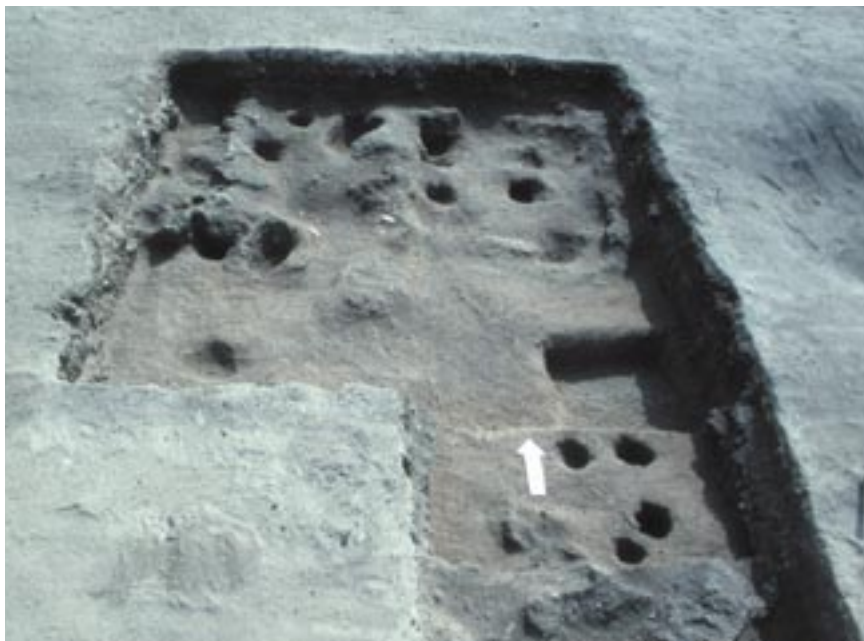
4. Hoyos de poste con 13.000 años de antigüedad en el Sector II del sitio QJ-280.