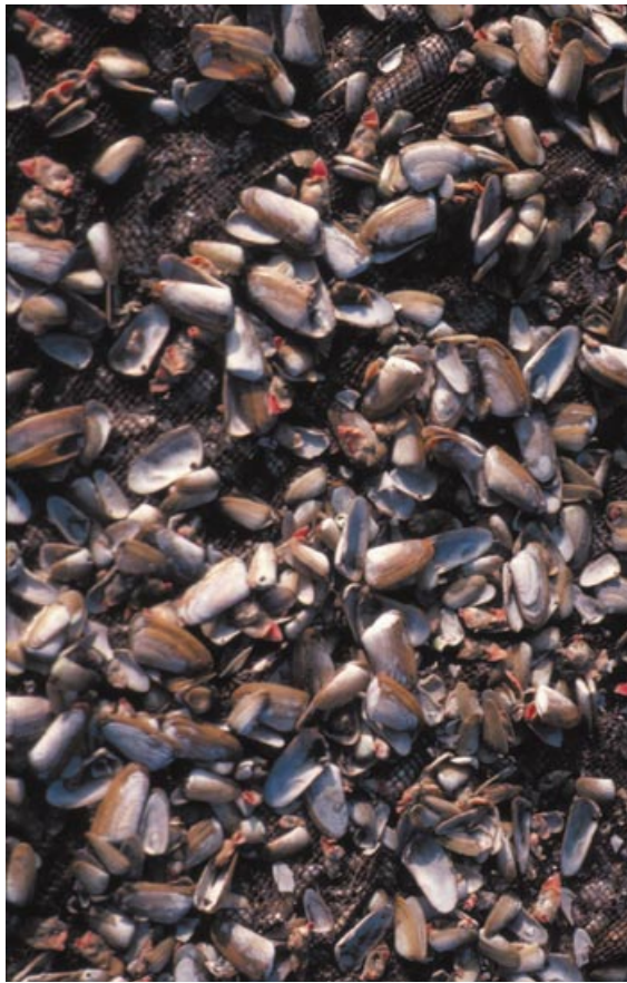
8. Machas frescas tendidas en una red para secar la carne y conservarla. Es probable que los antiguos habitantes de Quebrada Jaguay hicieran lo mismo.

Los descubrimientos obtenidos en el yacimiento QJ-280 y alrededores resuelven un interrogante, al par que abren otros muchos. No hay duda de la actividad pesquera de los paleoindígenas de América del Sur. Un equipo encabezado por el geólogo David Keefer ha descubierto otro enclave de pescadores a unos 200 kilómetros al sur de la Quebrada Jaguay, en la Quebrada Tacahuay. Ahora que