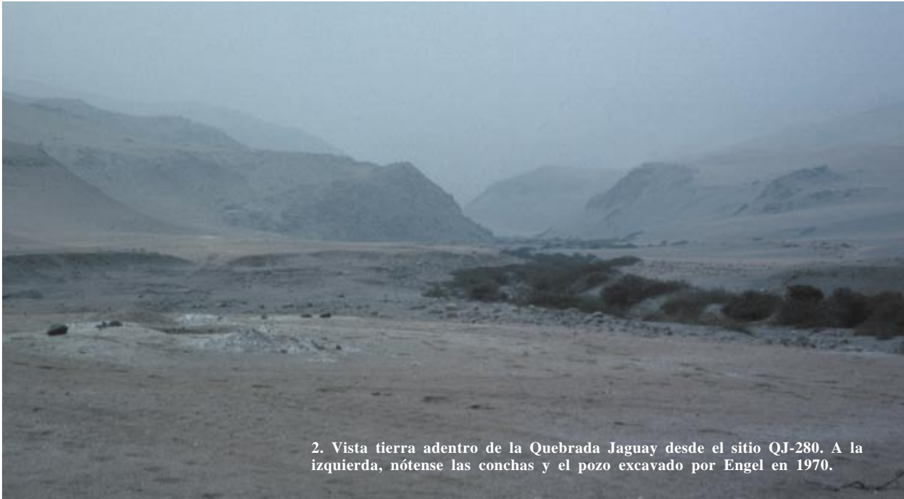
2. Vista tierra adentro de la Quebrada Jaguay desde el sitio QJ-280. A la izquierda, nótese las conchas y el pozo excavado por Engel en 1970.

Todavía en los años setenta, los yacimientos peruanos de pescadores costeros no se remontaban más allá de los 5800 años A.P. En 1981, James B. Richardson III, de la Universidad de Pittsburgh, observó que la fecha de 5800 A.P. coincidía con el momento en que el nivel global del mar se estabilizó cerca de su posición actual.