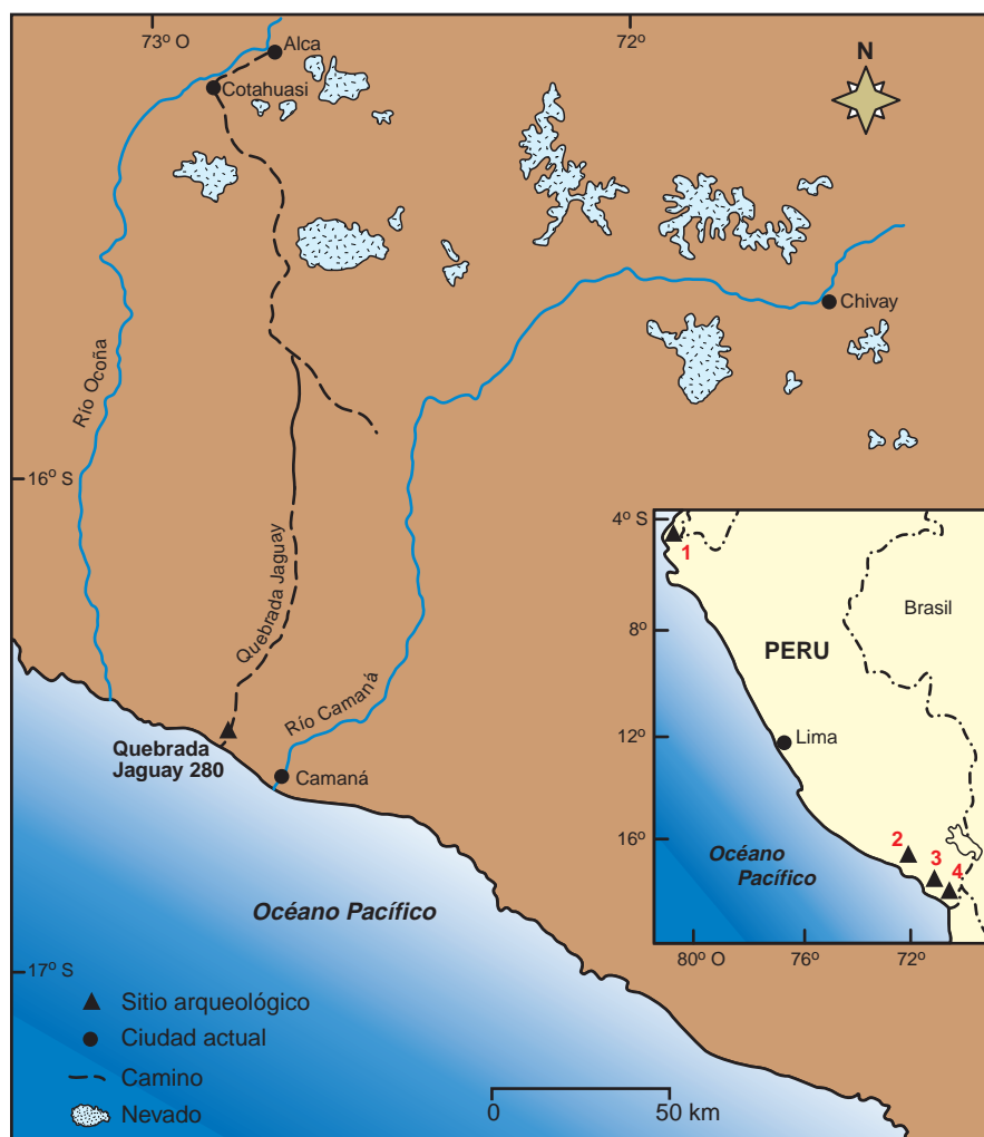
1. Mapa del sur del Perú que indica la ubicación de Quebrada Jaguay y la fuente de obsidiana en Alca. En el detalle se muestra el mapa del Perú y la ubicación de sitios marítimos tempranos: Campamentos Amotape (1), Quebrada Jaguay (2), Sitio Anillo (3) y Quebrada Tacahuay (4).

Esa interpretación errónea de la historia real se sustentaba, en parte, en la ausencia de yacimientos arqueológicos tempranos de zonas marginales, es decir, limítrofes con la costa o la selva, donde la megafauna era mucho más escasa que en la sierra.