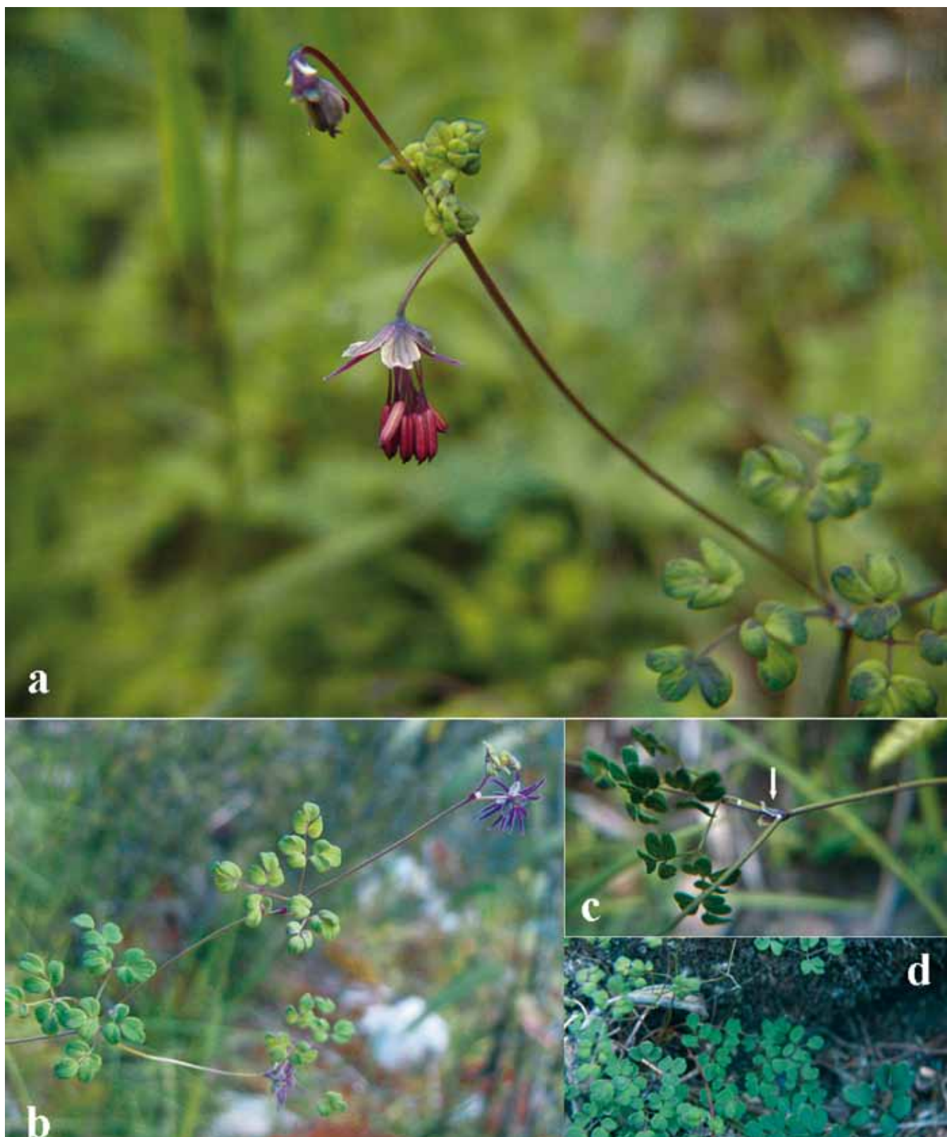
Figura 2. Thalictum peruvianum H. Trinidad & A. Cano; a) Rama con flor perfecta, b) Rama con flor femenina, c) Vaina auriculada sub-amplexicaule y d) Habito.