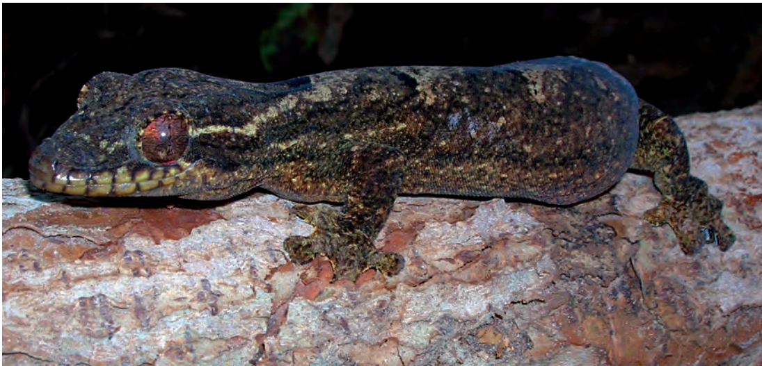
Figura 1. Thecadactylus solimoensis (Squamata, Phyllodactylidae)

gráficamente separadas en la Amazonía: una proveniente de Cuyabeno (Ecuador) y otra proveniente de Pará, incluyendo algunos datos colectados en Roraima, Rondonia y el centro de Pará. De acuerdo a la descripción y distribución señalada por Bergmann y Russel (2007), la población “ecuatoriana” de Thecadactylus rapicauda pertenece en realidad a Thecadactylus solimoensis , mientras que la población “brasileña” pertenece a Thecadactylus rapicauda .