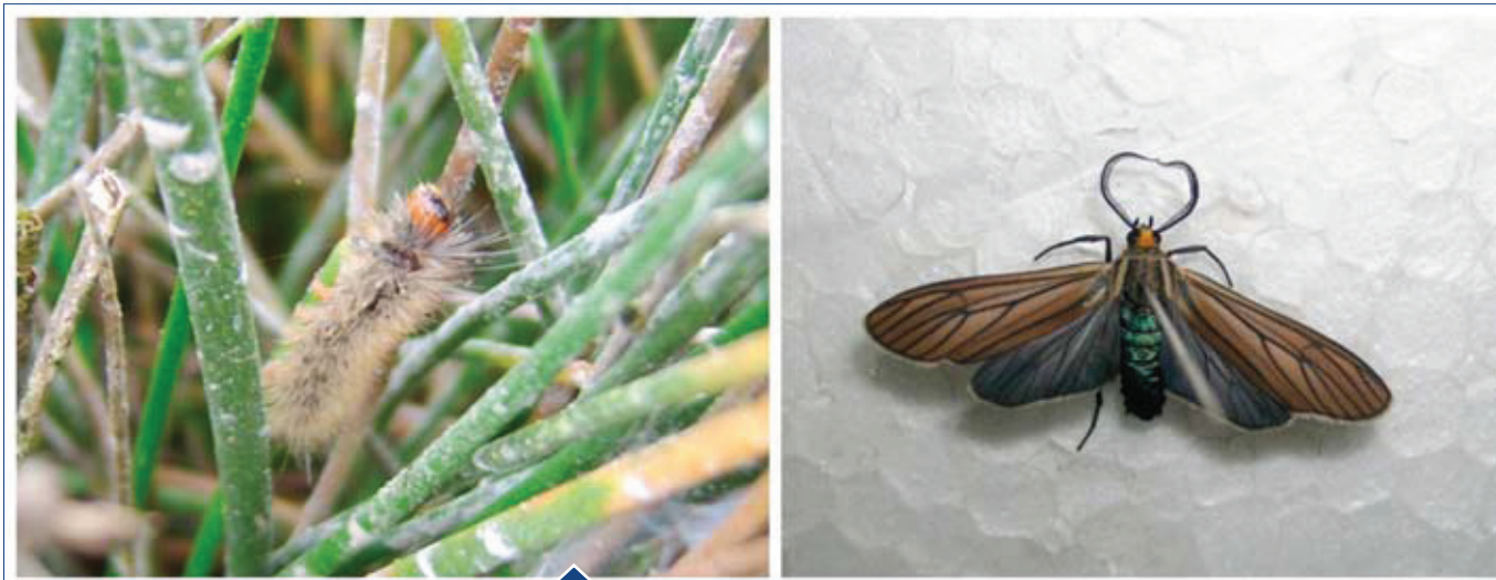
FIGURA 5. PHYLOROS NEGLECTA EN FASE LARVAL (IZQUIERDA) Y EN FASE ADULTA (DERECHA).

que influye en la calidad del proceso de extracción, así como en los impactos que puedan ocurrir sobre el sistema crecimiento - extracción - venta del junco. La destrucción por la agricultura y pastoreo, la forma irracional y muchas veces al azar del área utilizada para la extracción, la aparición de plagas por