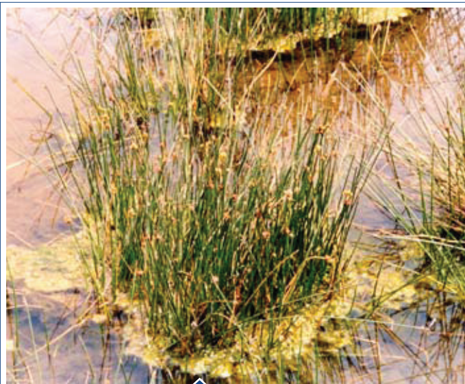
FIGURA 1. SCHOENOPLECTUS AMERICANUS : UNA ESPECIE FRECUENTE EN LOS HUMEDALES DE LA COSTA PERUANA.

Keywords: Schoenoplectus americanus , physiology, extraction of junco