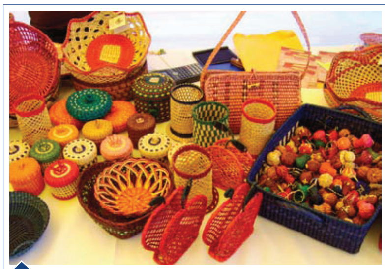
FIGURA 4. DIFERENTES PRODUCTOS FABRICADOS A PARTIR DE LA FIBRA DE SCHOENOPLECTUS AMERICANUS .

Los desechos producto del proceso de extracción son dejados en la parcela, lo que ocasiona la presencia de múltiples plagas. Una de ellas es un hongo conocido como "Roya". Este hongo ataca los tallos del junco pudiendo provocar hasta una pérdida del 80% del producto final. Este hongo puede atacar al junco durante el periodo de almacenamiento o cuando el junco se empieza a secar por senescencia (15).