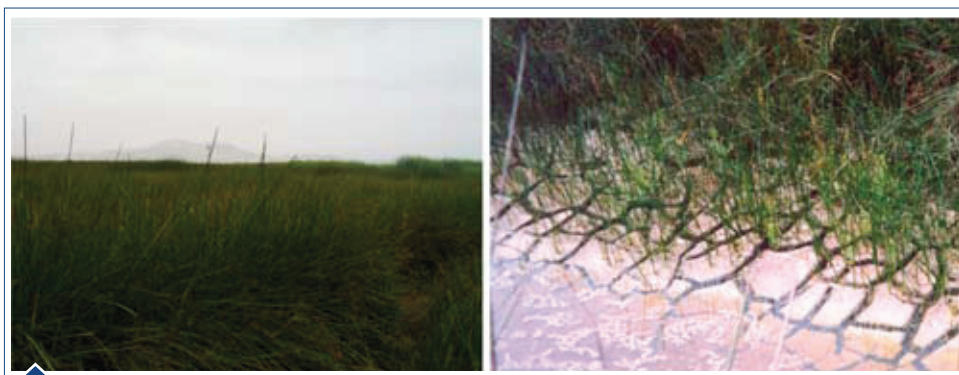
FIGURA 3. HÁBITAT DE SCHOENOPLECTUS AMERICANUS . IZQUIERDA: VEGA DE CYPERÁCEAS EN EL HUMEDAL EL PARAISO (HUACHO). DERECHA: SE APRECIA CÓMO LOS TALLOS CRECEN DE LAS RANURAS DEL FONDO DE UNA LAGUNA SALOBRE EN PUERTO VIEJO (CHILCA).

Esta especie ha mostrado ser muy adaptable a los hábitats de los humedales costeros, encontrándose en espejos de agua, totorales, zonas arbustivas y gramadales, además de formar grandes comunidades denominadas vegas de ciperáceas (Figura 3) (9). Asimismo, esta especie ha mostrado tener una gran capacidad para resistir los cambios de estrés salino sobre otras especies características de humedales como Eleocharis pallustris y Sagittaria lancifolia (8), así como para habitar en múltiples zonas disturbadas como bordes de ríos y acequias (3).